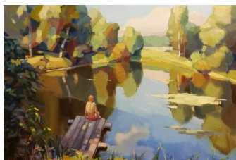
«Пруд» 50X60, холст, масло