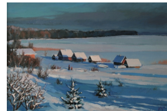
«Селигер. Декабрь» 35X50, холст, масло