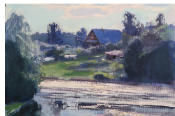
«Этюд» 35X40, холст, масло