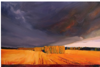
«Перед грозой» 30X40, холст, масло