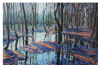
«Весенний свет» 60X70, холст, масло