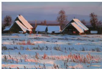
«Розовый снег» 45X60, холст, масло