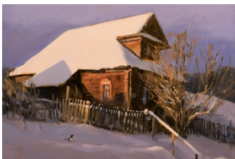
«Дом в Заполье» 50X60, холст, масло