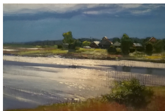
«Сорога» 45X60, холст, масло