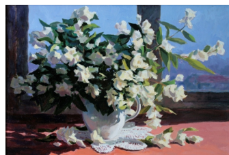
«Жасмин» 50X70, холст, масло