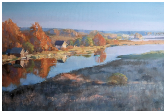
«Вечер в Октябре» 50X70, холст, масло